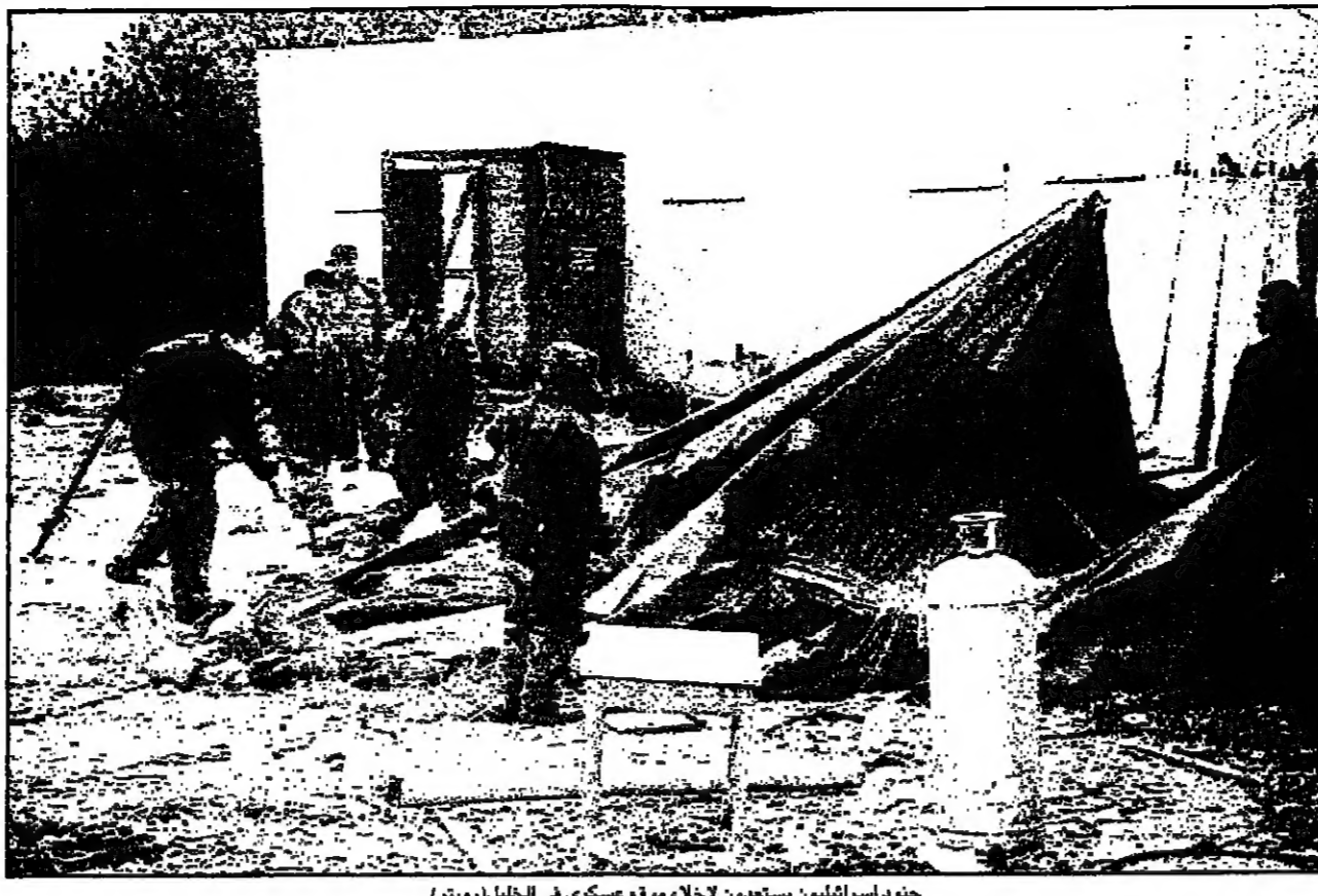
جنود اسرائيليون يستعدون لخلع موقع عسكري في الخليل